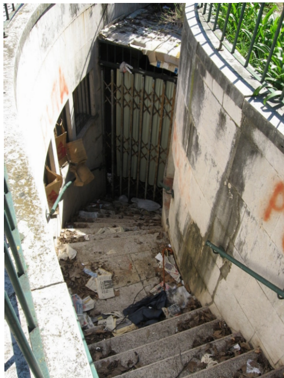
Aspecto desolador dos Sanitários da Praça José Fontana, ocupados pelos “sem abrigo”, perante a indiferença dos serviços autárquicos e das autoridades sanitárias

O Presidente prometeu uma Escola de Música Infantil que funcionaria a partir de Setembro de 2007. Onde está essa escola de música?