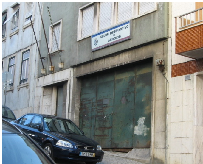
O portão fechado do espaço desportivo prometido

Surgem perguntas óbvias: A Junta de Freguesia arrendou, de facto, o espaço? Continuará a pagar a renda? Em caso afirmativo, quem será o SORTUDO proprietário?