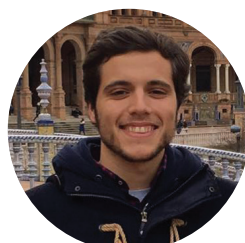
Francisco de Brito